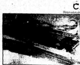
Rio Claro ganhará seu 1º shopping, no prédio de antiga fábrica. Pág. 4