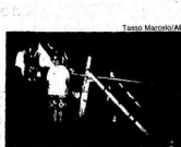
Imagem de santa leve a coroa rubrada por ladrões, em Copacabana. Pág. 3